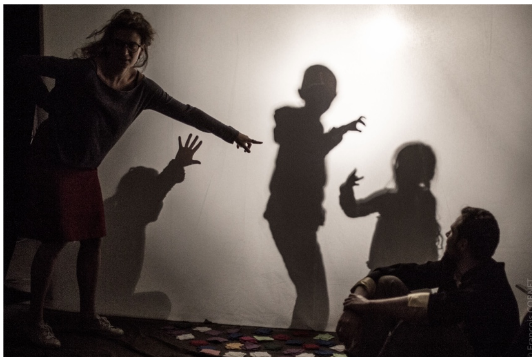
Avril 2019 - Lors d'une résidence de création à Sentein, en Ariège, nous avons ouvert une répétition à quelques enfants venus voir notre travail et jouer eux-même avec les ombres.

Soutenu par le ministère de la Culture et par l'Éducation Nationale, ce dispositif est une grande chance et un véritable tremplin pour les jeunes artistes, en plus d'être un apport riche d'un point de vue des rencontres humaines, de la pédagogie et du partage.