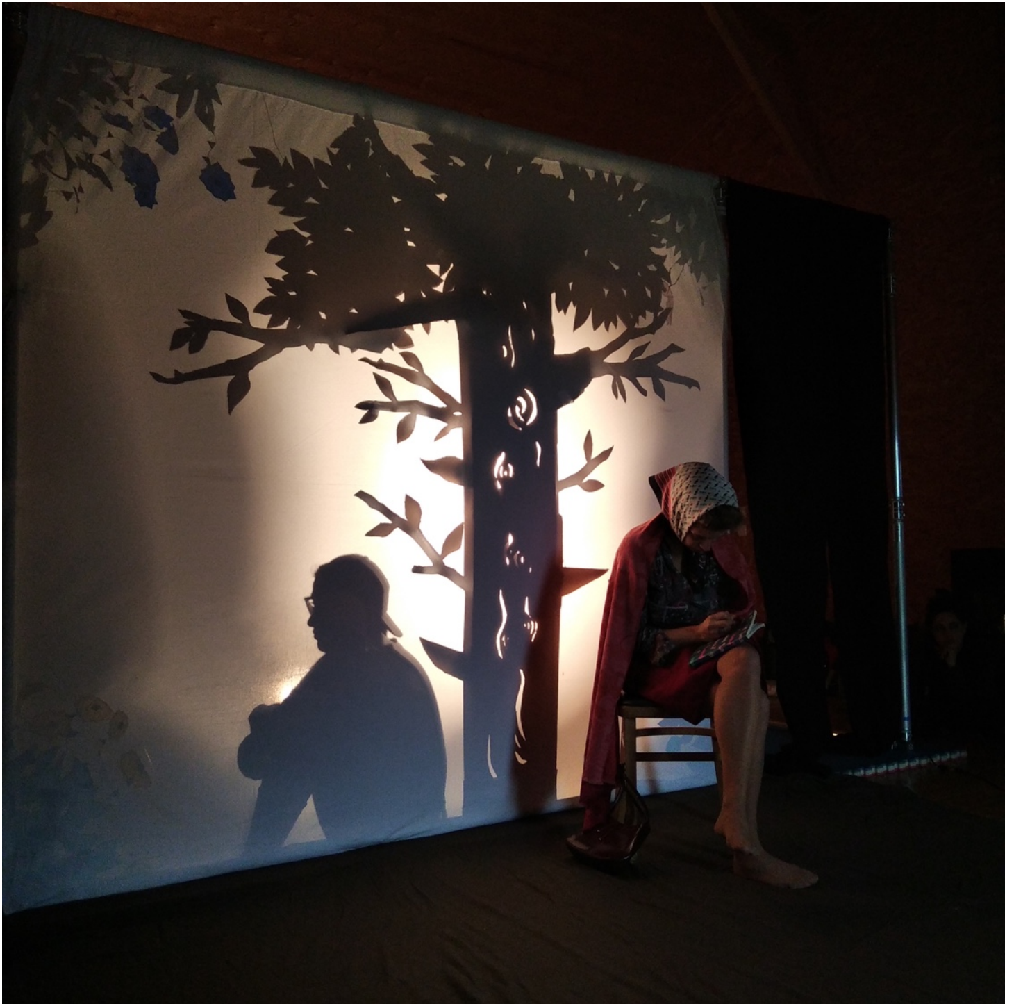
Décembre 2020 - Photo de répétition. La grand-mère en avant-scène et la jeune fille en ombre projetée.