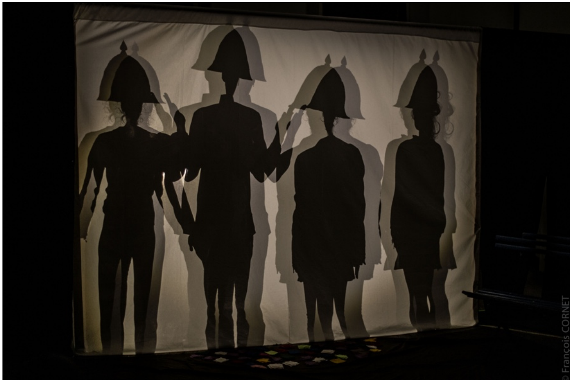
Avril 2019 - Photo de répétition. Gardes tranchants les rosiers des villageois.